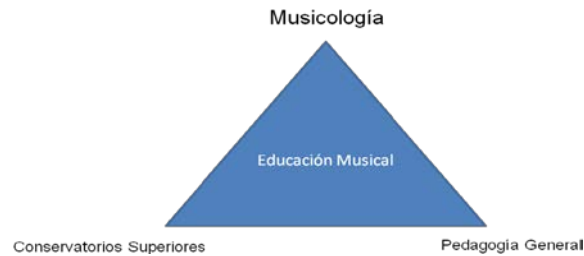
Figura 1. Triángulo edípico-musical

Por otra parte, la creación de una «Mención en Educación Musical» (1 semestre académico) en sustitución del extinto Título de Maestro en Educación Musical (6 semestres), y como parte de los estudios generalistas del nuevo Grado de Maestro en Educación Primaria , lejos de ser una concesión graciosa al Área por parte de la universidad española se nos presenta como una estrategia política que consiste en crear al Otro para poder marginarlo mejor. Así, desde el momento en que comenzaron a salir de las universidades los actuales “especialistas en música” 9 la sociedad dispone ya de argumentos más que suficientes para -si quisiera- poder mofarse de su deficiente preparación, el Área quedará más devaluada aún en los próximos años y, en consecuencia, se tendrán recursos dialécticos para marginarla mucho más de lo que está ahora, desde el momento en que el triángulo edípico-musical se hará aún más grande a favor de «las tres madres», quedando el Área de Educación Musical (EM) su sombra (Fig. 2).